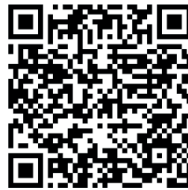
Play Store (Android)